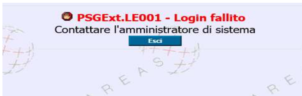
(Fig 5 Schermata Login Fallito)

In caso di disattivazione dell'utenza sarà necessario inviare una mail a Contact Center LazioCrea contactcenter@laziocrea.it per ricevere assistenza tecnica o per il reset della password.