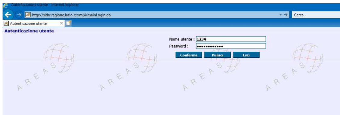
(Fig 1 Schermata Login)

Per politiche sulla privacy non è possibile richiedere reset password a nome di terze persone.