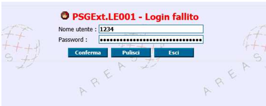
(Fig 3 Schermata Errore Login)

In caso di accesso errato apparirà il messaggio in Fig 3