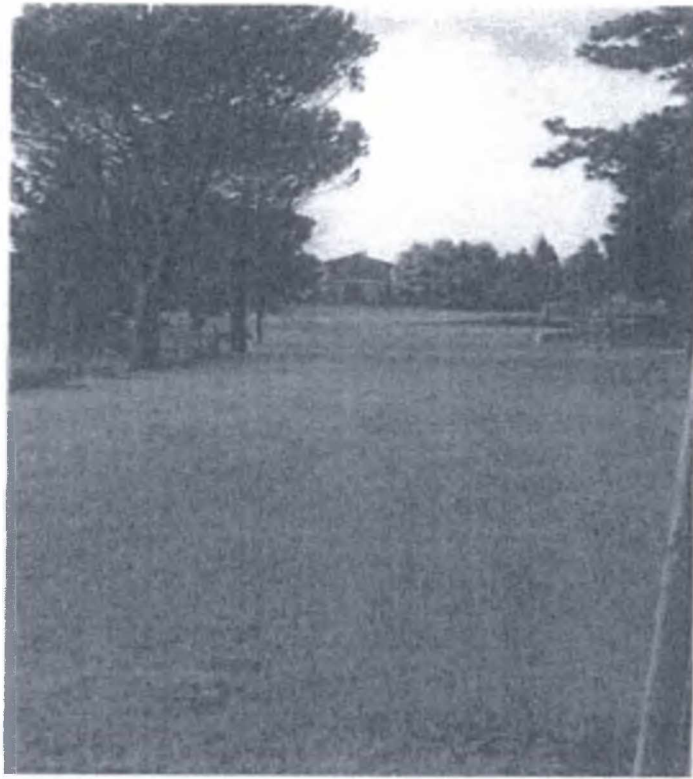
Parco Comunale "Il Monte"